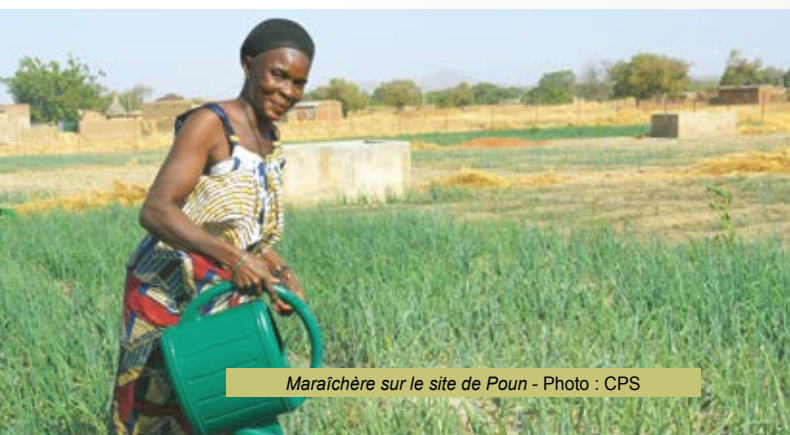
Maraîchère sur le site de Poun

L'évaluation à mi-parcours, réalisée en 2022 par des experts externes, nous confirme que le projet, géré par notre partenaire local CEAS Burkina, est sur une bonne trajectoire pour atteindre les objectifs et résultats attendus fin 2024. Afin de corriger certaines insuffisances pour la durée restante du projet, des recommandations ont été formulées. Parmi celles-ci, on peut citer un suivi plus rapproché des coopératives par l'équipe du projet. De même que la poursuite de l'organisation de la production maraîchère (agroécologie) et des producteurs à travers des formations techniques et l'accompagnement à la recherche de débouchés. Actuellement, les infrastructures d'hydraulique, fonctionnant avec un système de pompage solaire photovoltaïque, ont été installées afin d'assurer la disponibilité en eau toute l'année sur tous les sites de maraîchage (1 site par village). La production maraîchère a bien démarré et les activités de transformation et de stockage viennent de commencer.