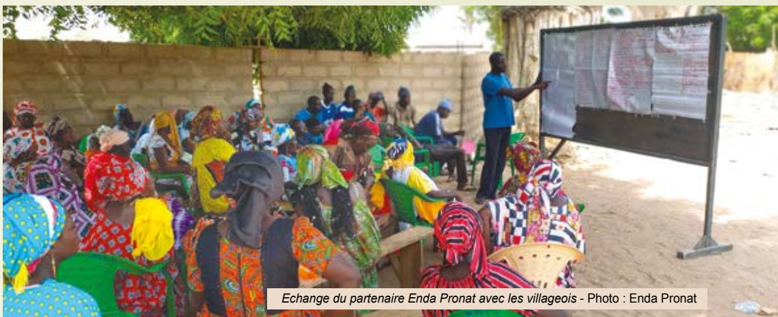
Echange du partenaire Enda Pronat avec les villageois

Le nouveau projet au Sénégal mis en œuvre par notre partenaire Enda Pronat, le premier que nous appuyons en dehors du Burkina Faso depuis presque vingt ans, vient de démarrer en janvier 2023 avec des diagnostics villageois agroenvironnementaux et organisationnels dans les 10 villages du projet en vue de la mise en place et du renforcement de caisses autogérées. A travers les discussions, les producteurs/trices ont soulevé les problèmes majeurs qui touchent leur agriculture et leur environnement. A l'issue de ces diagnostics, une étude approfondie des jardins maraichers et l'identification des bénéficiaires des semences et du matériel agricole seront entre-autres réalisés.