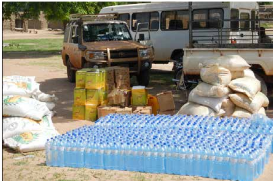
Vue partielle des vivres distribués à Barani

Dans le contexte d'insécurité au Nord du Mali, des Touaregs maliens s'étaient réfugiés dans la commune Barani, située à l'Ouest du Burkina Faso, plus précisément dans la province de la Kossi. Grâce à la générosité des populations locales, elles même fragilisées par une crise alimentaire aigue, les réfugiés étaient pris en charge à leur arrivée. Dans un premier temps ils étaient hébergés dans des familles.