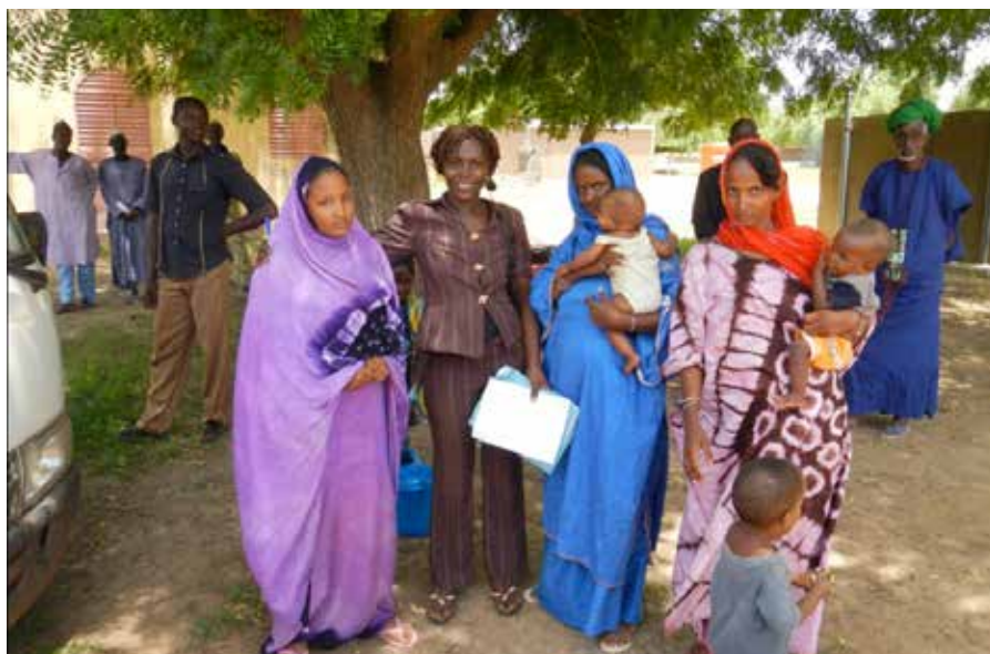
La comptable de l'OCADES en compagnie de réfugiés à Barani

dass sie beim Verloscht vun hire Léiwsten un déi Leit geduecht hun, denen et nèt esou gut geet.