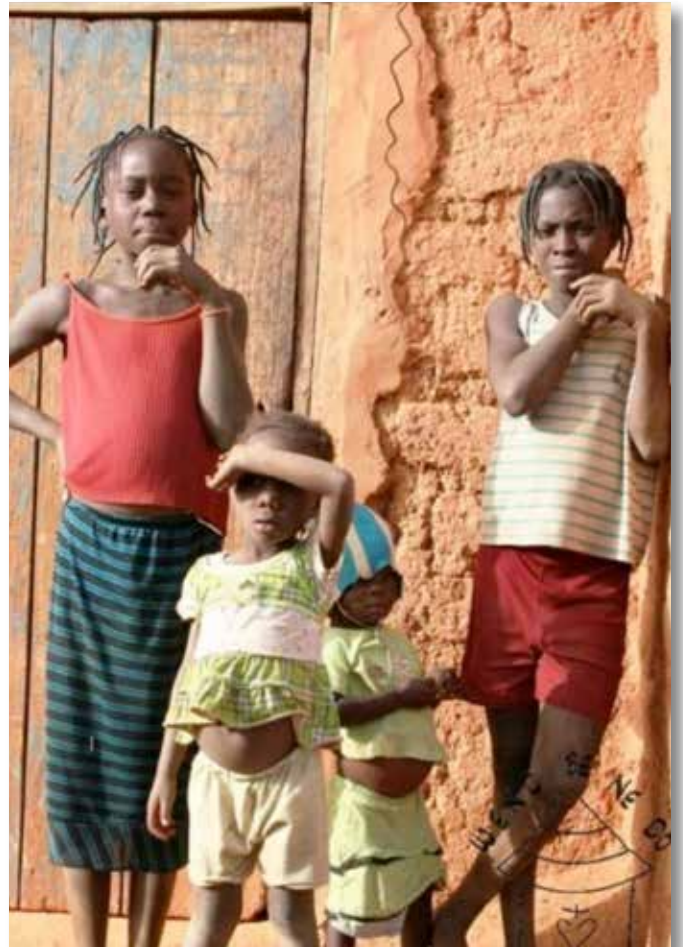
d'Kanner vun Wend Be Nedo zu Kongoussi

Esou konnten d'Kanner während der klenger Chrëschtfeier hire Misär e bësse vergiessen.