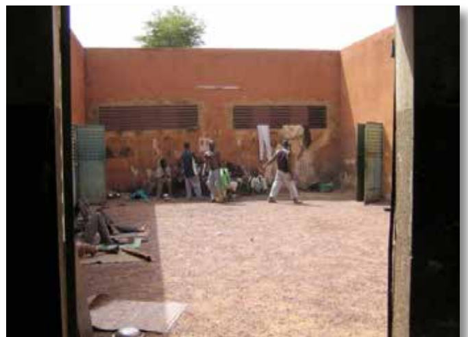
Den Haff wou d'Prisonnéier duerfe spadséiere goen

Am ganze 77 Prisonnéier, déi keng Familljememberen hunn, déi si kéinten ënnerstëtze sinn en Charge geholl gi wéinst hire Gesondheetsproblemer. Déi meescht vun hinen haten Tuberkulose. Wat déi medizinesch Prise en Charge ugeet, muss e leider feststellen, dass et kaum Ënnerstëtzung vum Staat fir krank Prisonnéier gëtt.