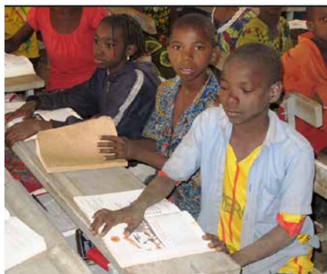
L'éducation est au cœur des activités de CPS

Dans tous les lieux visités, l'accueil extrêmement chaleureux des populations a bien traduit l'impact positif de ces actions sur l'amélioration de leurs conditions de vie. Cependant, malgré tous ces efforts, l'exode rural se poursuit en raison de l'accroissement démographique, avec ses conséquences défavorables, notamment sur l'enfance défavorisée. C'est dans cette optique que la