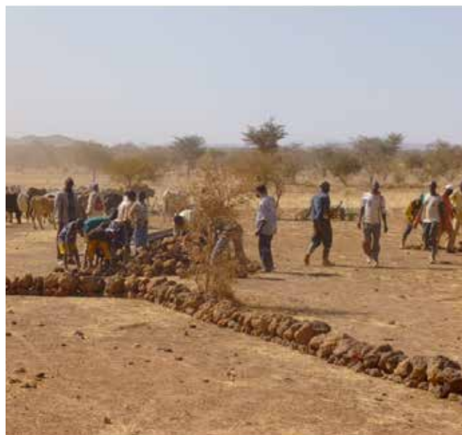
Restauration des sols par l'installation de cordons antiérosifs

Le voyage s'est terminé à Kongoussi, dans une région caractérisée par un climat aride, par la visite du projet de conservation des eaux et restauration des sols couvrant une vingtaine de villages de la province de Bam, dont le partenaire est l'Association des Jeunes pour l'Environnement et l'Elevage (AJPEE). Dans cette même localité, une visite a été rendue à l'association Wend Be Nedo, œuvrant en faveur de personnes atteintes par le virus du SIDA, et que CPS a soutenue récemment dans le cadre de l'action de Noël.