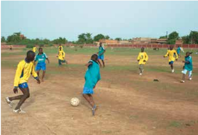
Betreuung von Straßenkindern