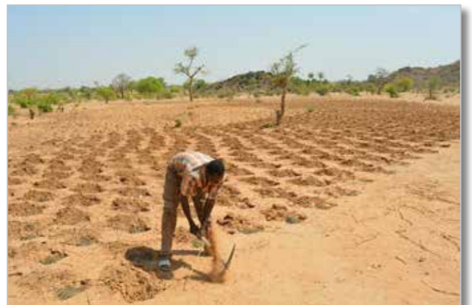
Rückgewinnung degraderter landwirtschaftlicher Flächen

Die Provinz Bam ist eine der niederschlagsärmsten in Burkina Faso. Die Böden sind arm, haben eine geringe Wasserrückhaltekapazität und sind teils stark erodiert.