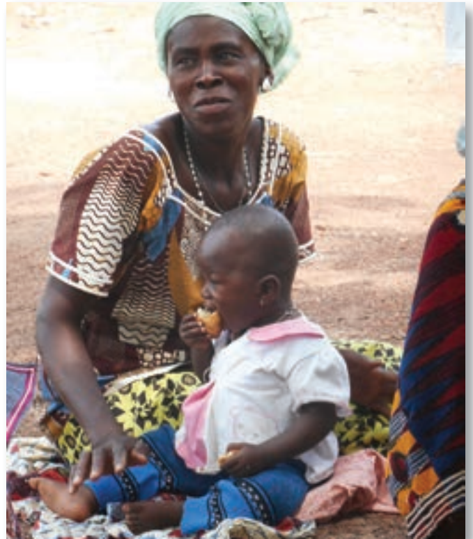
Une femme et son enfant du village de Sogossagasso.

Cette expérience m'a ouvert les yeux sur des choses qui me semblaient évidentes avant mon départ, mais que je vois à présent d'un tout nouveau point de vue. Cela m'a également permis de mieux apprécier ce que j'ai, à m'attarder sur les petites joies de la vie et à garder les pieds sur terre au lieu de vouloir toujours voir plus grand. C'est une aventure que je conseillerais à tous et à chacun.