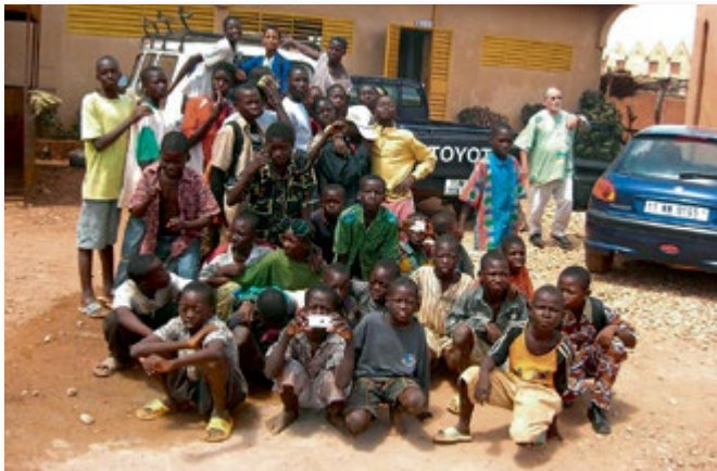
Die Jungen im Zentrum ATY

Es gibt mehr als 2500 Straßenkinder in der Hauptstadt von Burkina Faso.