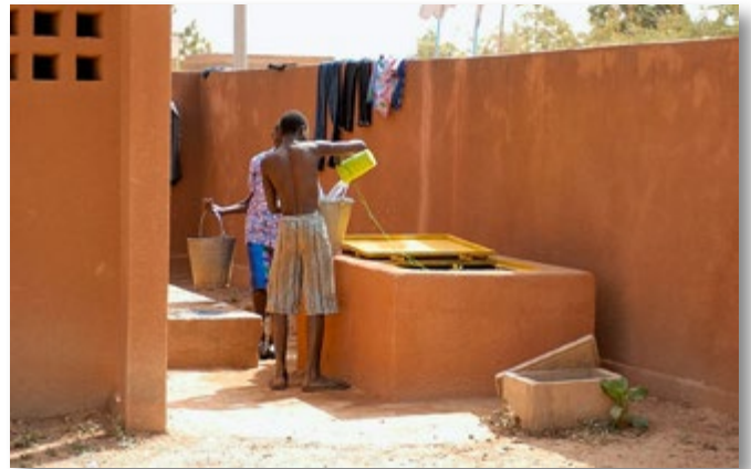
Hygiene im Zentrum ATY

Zu ihrem Alltag gehören Drogenmissbrauch und Gewalt. Einige unter den Jüngsten, sind Opfer von Pädophilie und Prostitution.