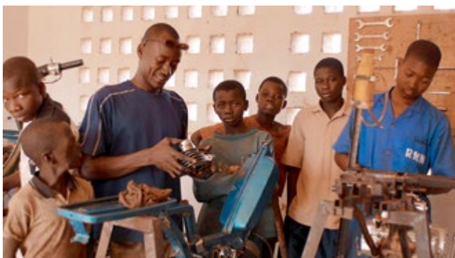
Berufliche Weiterbildung im Atelier von Taab Yinga

In der Auffangstruktur der Vereinigung Taab Yinga ist Platz für etwa 20 Jungen. Dort lernen sie lesen, schreiben und rechnen und haben die Möglichkeit einen Beruf zu erlernen.