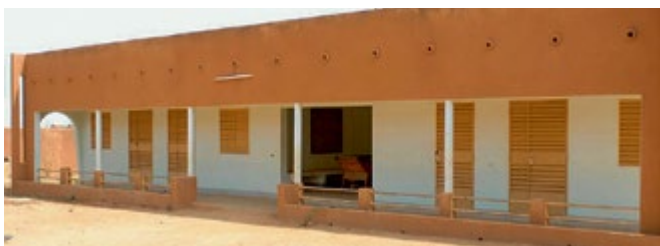
Auffangstruktur und Heim von Taab Yinga

Falls all dies nicht möglich ist, wird versucht die Kinder im Auffangzentrum unterzubringen. Probleme wie fehlende Nahrung, Kleidung oder Übernachtungsmöglichkeiten sind hier gelöst. Hier werden die Kinder auch dazu angehalten, ihre Intelligenz und ihre natürlichen Fähigkeiten zu entwickeln.