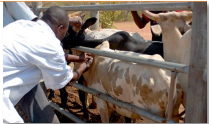
Impfung der Viehherden

Das Budget beläuft sich auf 35000 € pro Jahr.