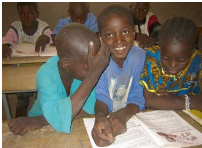
Salle de classe au Burkina Faso