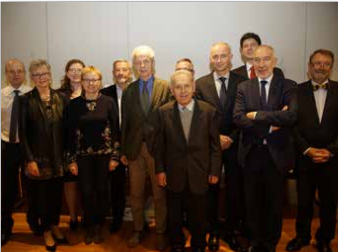
Collecte de Fonds bei engem Dîner de Solidarité