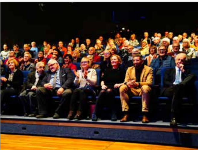
35. Gebuertsdag vu Chrëschte mam Sahel