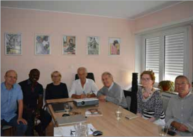
Reunioun um Siège vun der Fondatioun

Wenn du bei Nacht den Himmel anschaust, wird es dir sein, als lachten alle Sterne, weil ich auf einem von ihnen wohne, weil ich auf einem von ihnen lache.