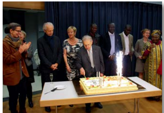
Zufriedene Gesichter beim Anschneiden des Geburtstagskuchens