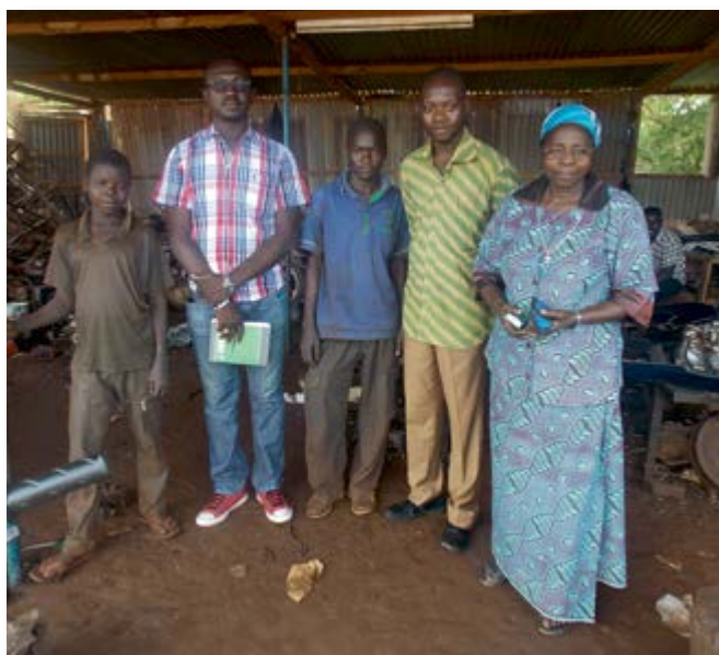
Formation professionnelle des enfants – Visite de notre Représentant Permanent (2 ème à partir de la gauche)