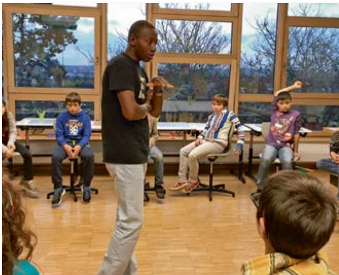
Geschichte, Geographie und Französisch für die Großen