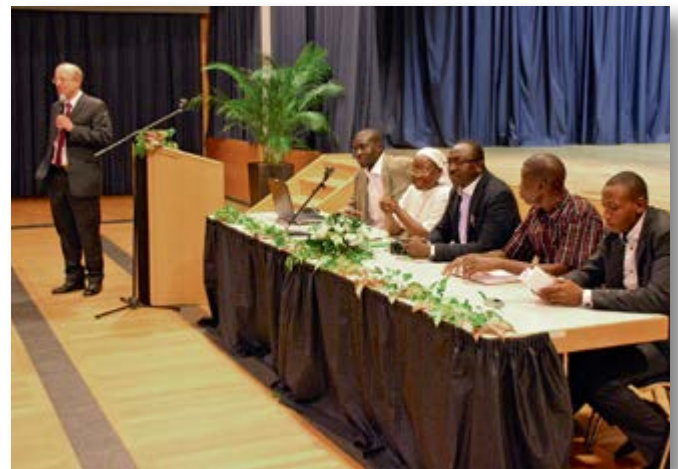
Unsere Partner aus Burkina Faso