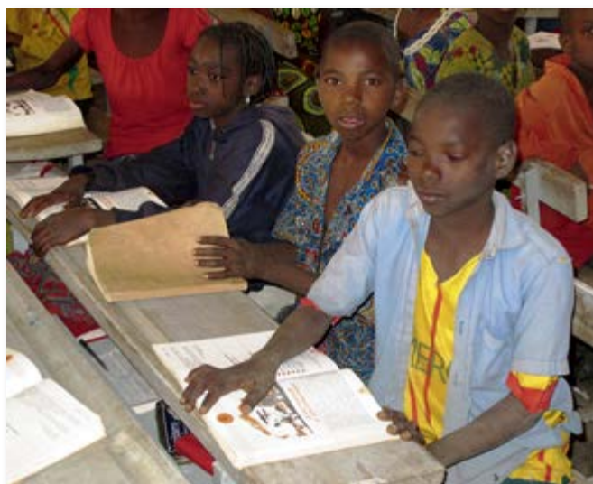
Scolarisation des enfants dans le primaire et le secondaire

Les enfants et leur famille sont suivis de façon rapprochée par l'Association Wend Benedo à travers des visites à domicile, à l'école et aux ateliers.