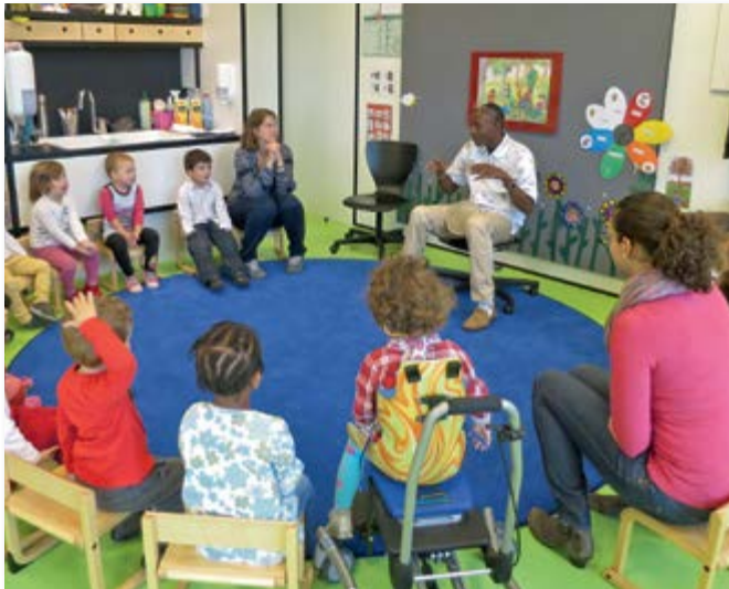
Musik- und Gesangsunterricht für die Kleinen