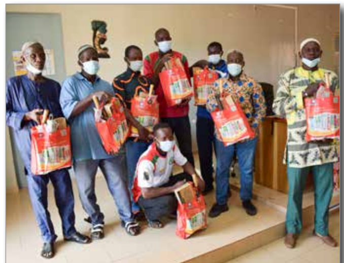
Schulung von Reparaturpersonal

Unsere Programme stärken die Gemeinden in ihrer Rolle als Hauptakteur der Wasserversorgung. Hierbei werden unter anderem Kapazitäten aufgebaut, um einen effektiven Einsatz von Reparaturpersonal zu gewährleisten, damit die Dauer von Ausfällen bei Wasserpumpen auf ein Minimum reduziert wird.