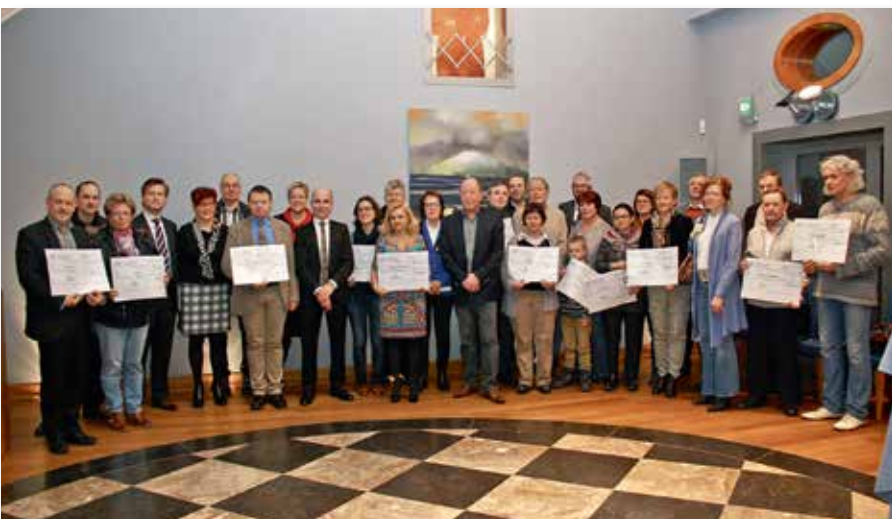
Gemeng Betzder: 2500 €