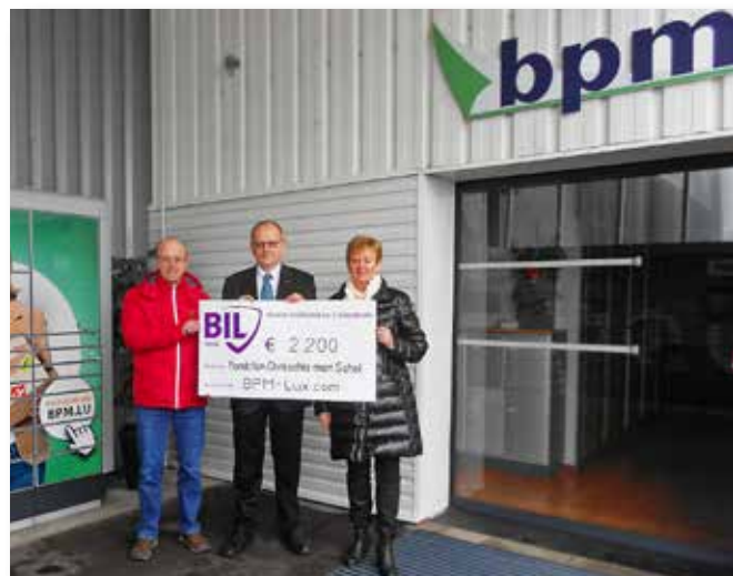
BPM-Lux: 2200 €