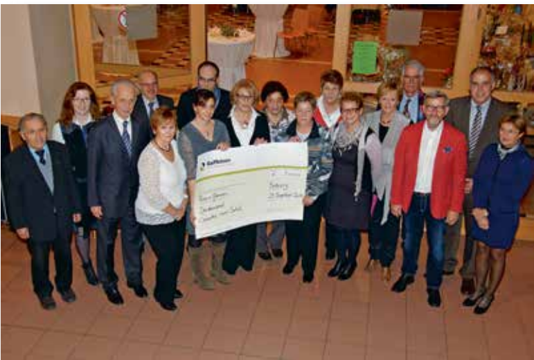
Fraen a Mamme Berbuerg: 3000 €