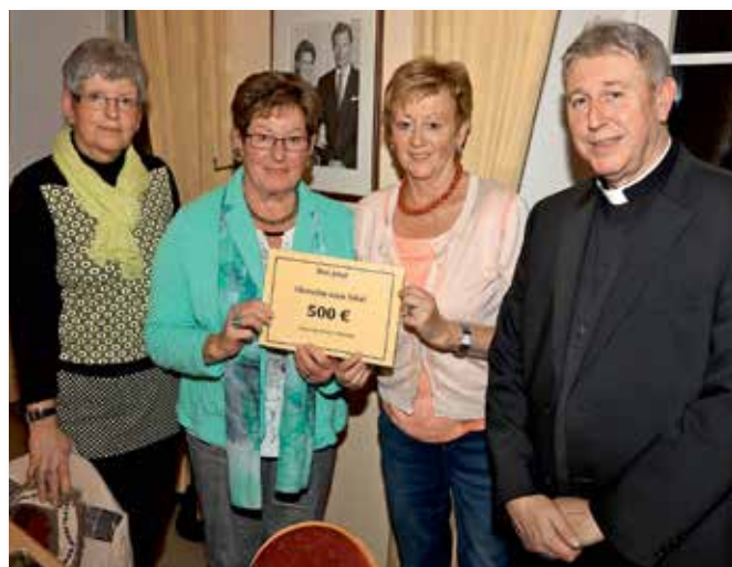
Fraen a Mamme Réimech: 500 €