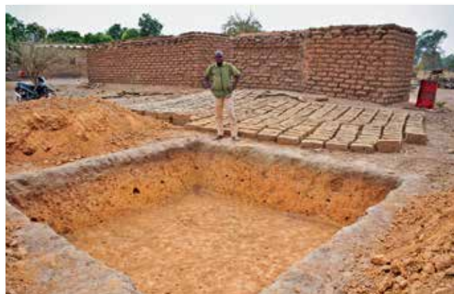
Fosse fumière vide