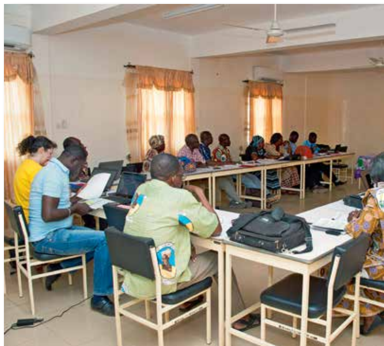
Réunion de bilan avec nos partenaires

MERCI FIR WEIDER HËLLEF: Donen oder Ordres permanents