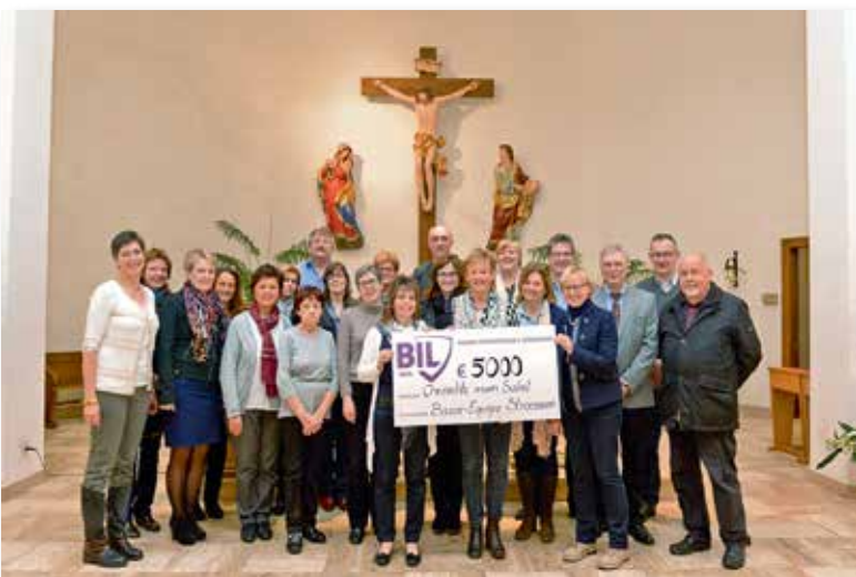
Œuvres paroissiales Stroossen: 5000 €