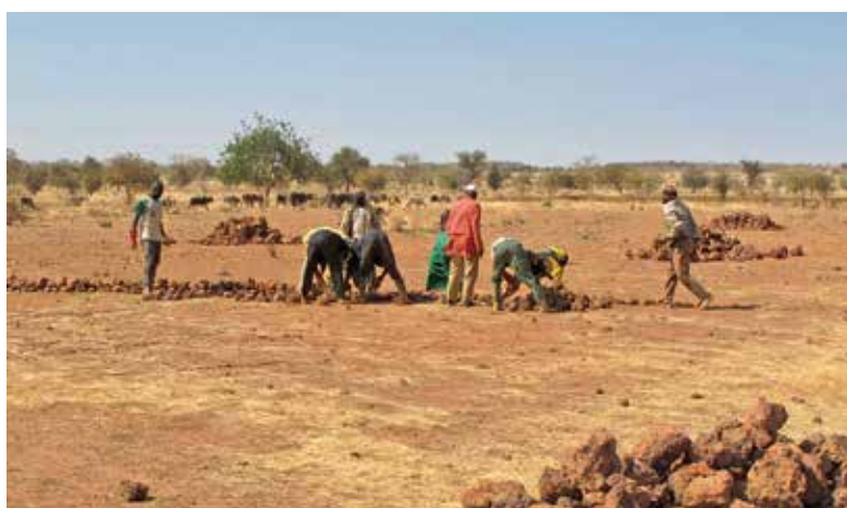
Mise en place de cordons pierreux