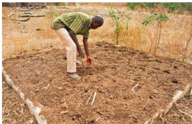
Fosse fumière remplie

Un tiers des terres du pays sont considérées comme dégradées. Les conséquences sont néfastes : disparition du couvert végétal, fragilisation des écosystèmes, baisse de la fertilité des sols, baisse des revenus des habitants, migration des populations, aggravation de la pauvreté, exacerbation des conflits fonciers, etc.