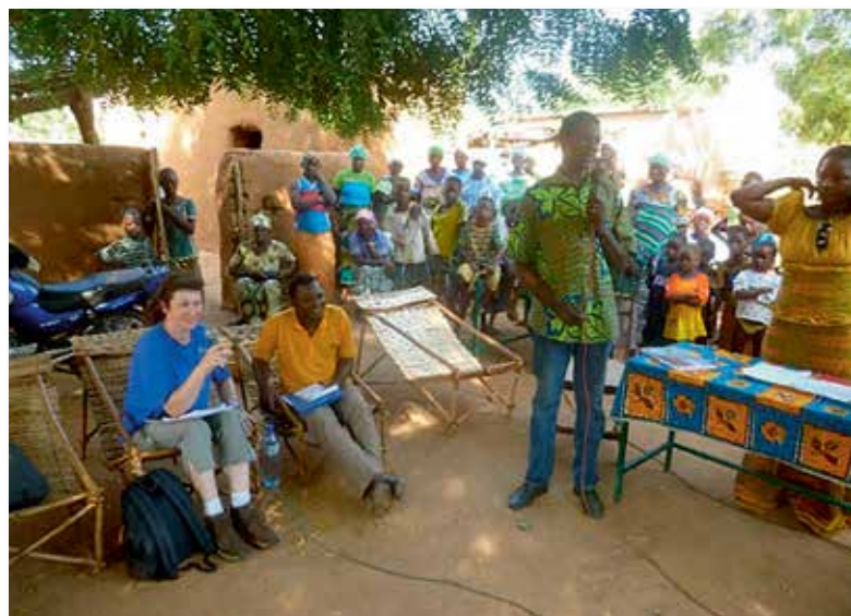
Rencontre avec les bénéficiaires