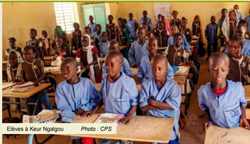
Elèves à Keur Ngalgou

La sensibilisation à l'environnement par le reboisement joue aussi un rôle important. En outre, la gouvernance éducative sera consolidée via la création de comités de gestion scolaire incluant parents, enseignants et élèves, ainsi que l'établissement de gouvernements scolaires pour responsabiliser les jeunes. Enfin, une priorité