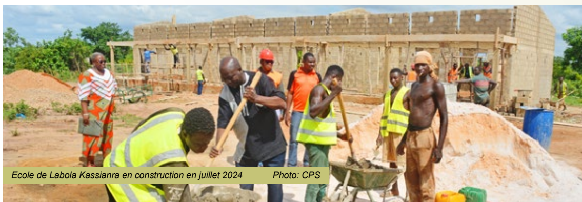
Ecole de Labola Kassianra en construction en juillet 2024

Dans la province de la Comoé, les conditions d'apprentissage sont de manière générale peu favorables. Par conséquent, nous sommes confrontés à un faible taux d'accès à l'éducation au fondamental, à un faible taux de maintien des élèves dans le circuit et à un faible taux de succès des élèves.