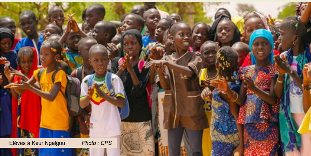
Elèves à Keur Ngalgou

En 2024, plusieurs réalisations concrètes sont déjà visibles. Le projet a réussi à mobiliser les communautés autour des écoles et à conclure des conventions avec les maires pour assurer une participation active. La construction de nouvelles salles de classe et la réhabilitation d'infrastructures existantes ont débuté, accompagnées de la confection de nouveaux tables-bancs. Par ailleurs, des initiatives de reboisement impliquant les élèves sont en marche, et l'augmentation des visites d'inspection garantit la qualité des interventions.