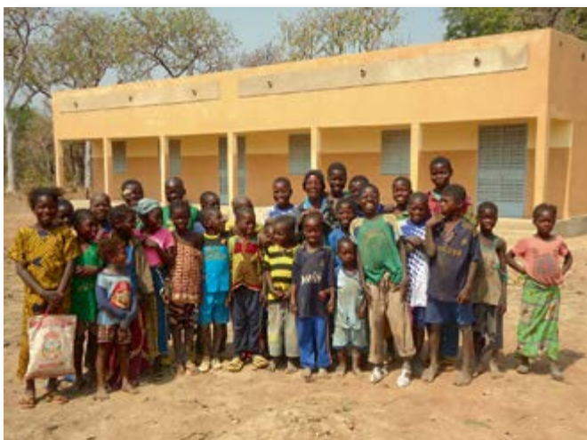
Neue Schule von außen ...

Im Jahr 2014 werden ein weiterer Klassensaal sowie Dienstwohnungen für Lehrer gebaut, so dass sich die Schule kontinuierlich weiterentwickelt.