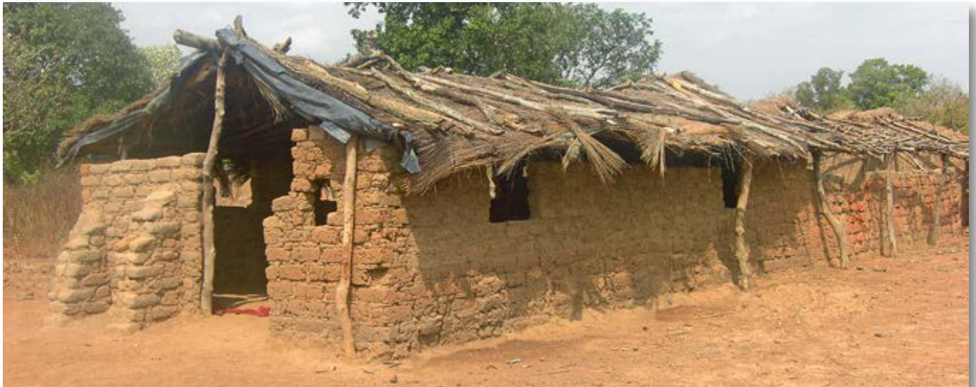
Alte Schule von außen ...

Balgogo liegt entlegen in der Provinz Banfora in Burkina Faso. Das Dorf verfügte lediglich über eine notdürftige Schulunterkunft, wo ein geregelter Unterricht kaum noch durchzuführen war.