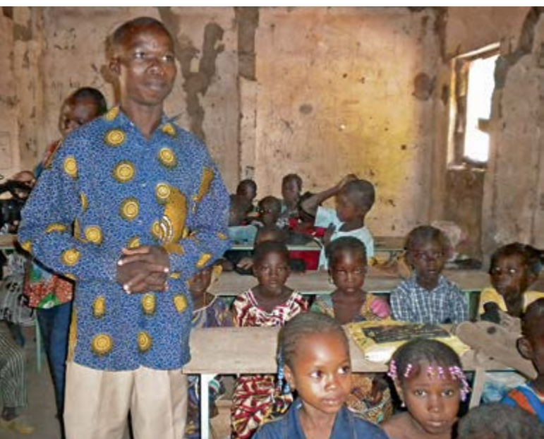
Salle de classe du village de Goni à reconstruire

Le village de Goni est situé dans la province des Banwa, commune rurale de Dokuy et fait partie du Programme de Développement Intégré (PDI) de Nouna. Sa population s'élève à environ 3.584 habitants. La province des Banwa est située au Nord-Ouest du Burkina Faso et est l'une des plus pauvres du Burkina Faso.