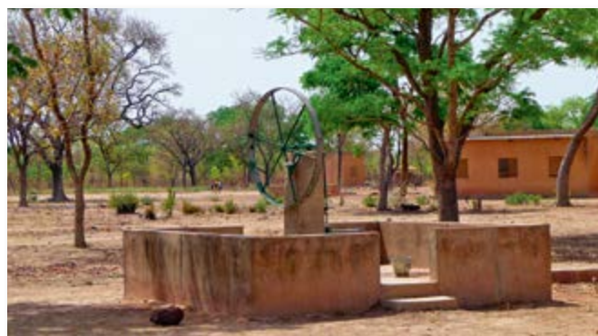
Forage pour assurer l'adduction d'eau