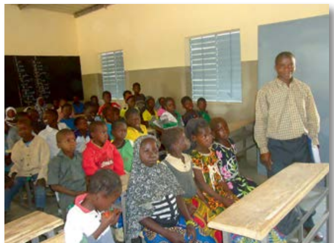
... und von innen