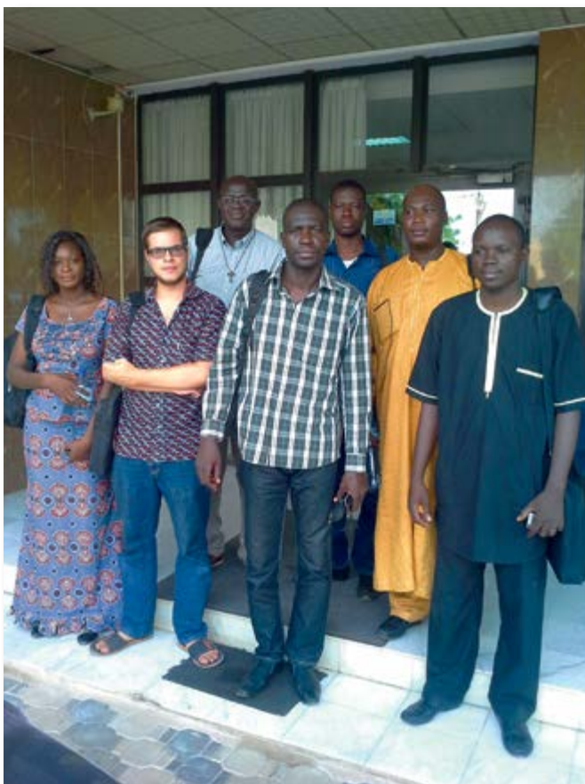
En réunion de travail à Ouagadougou

J'ai beaucoup appris que ce soit sur le plan personnel ou professionnel au cours de ce volontariat qui aura duré au total six mois, dont cinq mois et demi au Burkina-Faso. Je tiens à remercier tous les membres de CPS de m'avoir permis d'effectuer ce volontariat, ainsi que toutes les personnes qu'il m'a été donné de rencontrer ou avec lesquelles j'ai travaillé pendant ce volontariat.