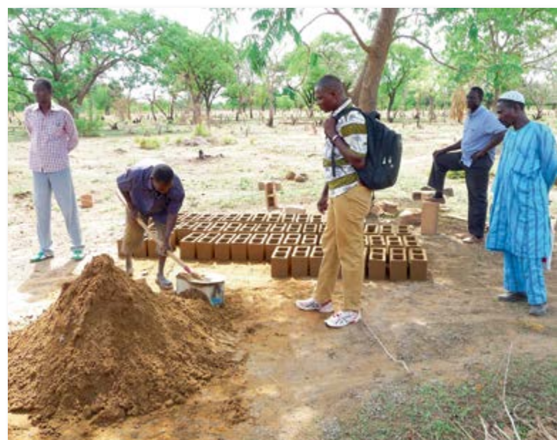
Visite du chantier du complexe scolaire de Djigouan