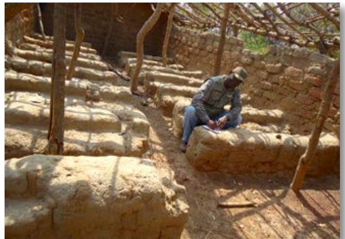
... und von innen

Das Budget belief sich insgesamt auf 23.744 EUR und wurde zu 80% vom Luxemburger Außenministerium finanziert. 1,5% wurde von den Dorfbewohnern getragen während die letzten 18,5% durch Spenden finanziert worden,