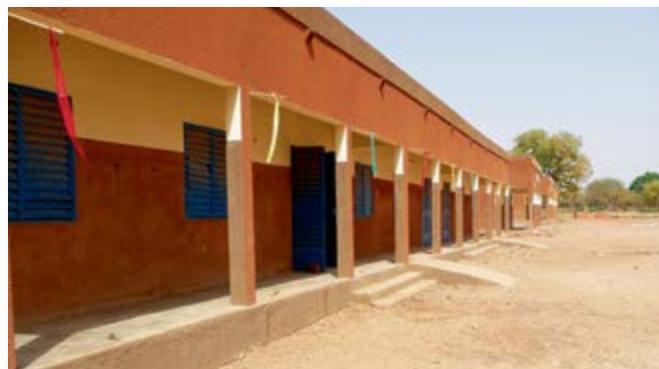
Salles de classe de l'école de Djigouan

Entre 2008 et 2014, le nombre d'élèves est passé de 131 à 200 et le taux de scolarisation de 29,98% à 42,83%. De plus la parité des sexes a augmenté. En 2008, 35,88% des élèves étaient des filles, en 2014 ce taux est monté à 45,50%.