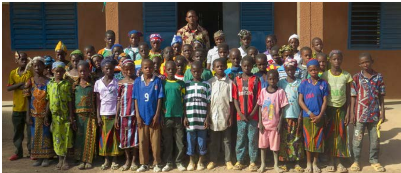
Des élèves du cycle 4.1 de Djigouan avec leur instituteur