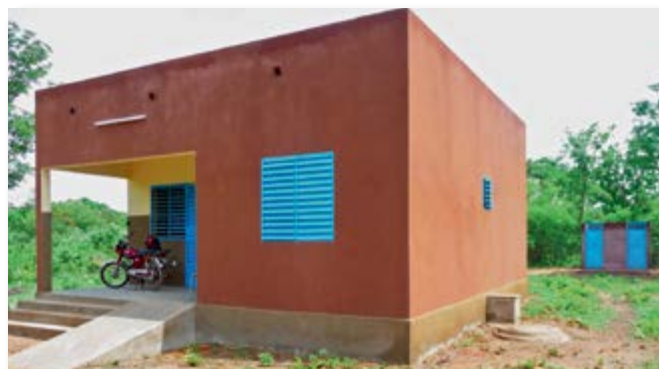
Logement pour enseignant et bloc latrine