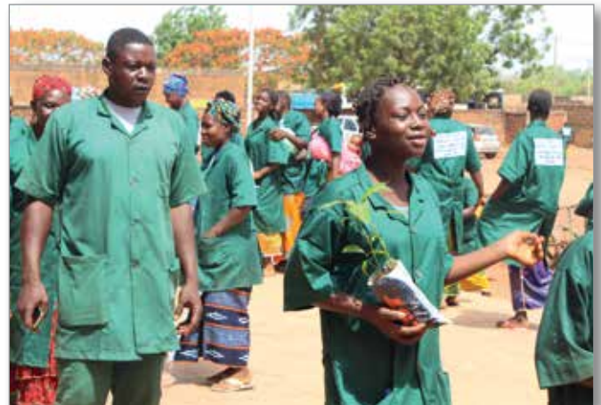
Journée de l'écologie avec conférence, séance de salubrité et sensibilisation à l'écologie