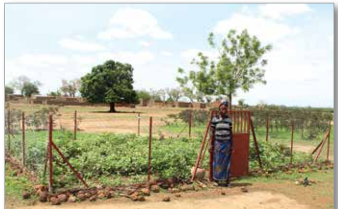
Jardin super potager familial