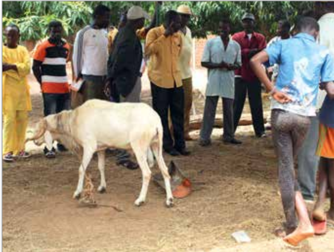
Formation sur l'élevage des moutons