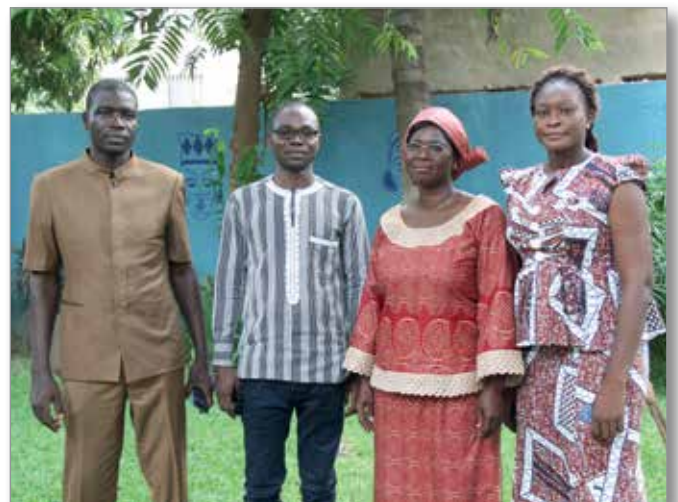
Délégation de l'Ocades de Dédougou

Le PDI nous a réveillés et nous a permis de nous rendre compte que nous avons tous les atouts en main pour assurer notre propre développement.