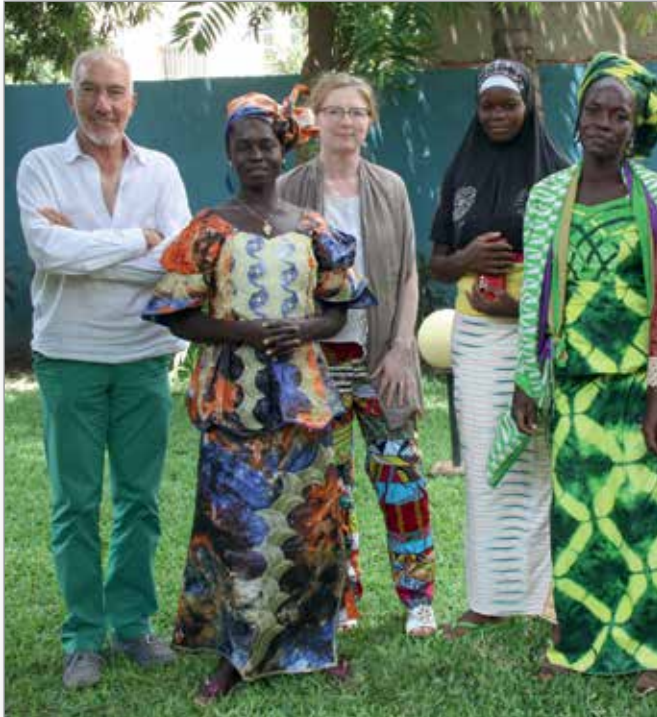
Délégation des villages avec les administrateurs CPS

Au début du mois de juillet, lors de notre dernière mission au Burkina Faso, nous avons pu y rencontrer la délégation de femmes des villages de Kolan et de Zouma, villages situés dans la commune de Toma, dans la province de Nayala.