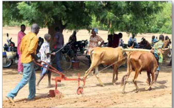
Mécanisation de l’agriculture