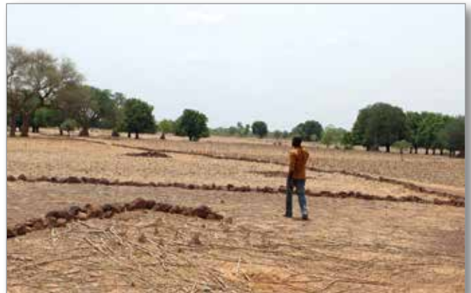
Cordons pierreux dans un champ