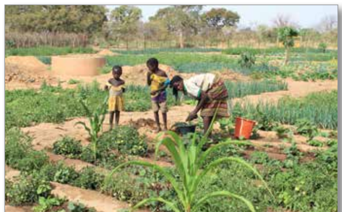
Périmètre maraîcher avec clôture, 3 puits-forages et 1 moto pompe