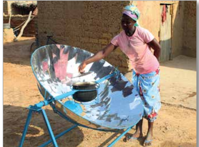
Installation d'une marmite solaire