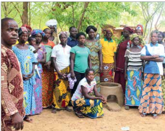
Formation en fabrication des foyers améliorés