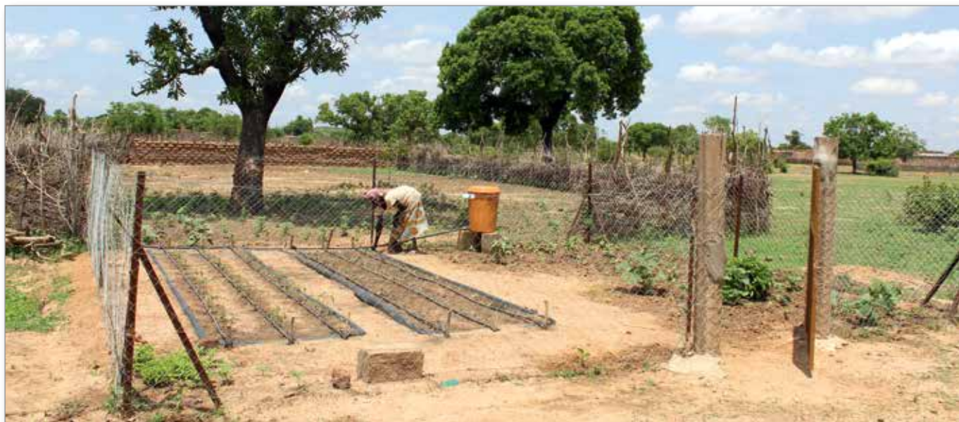
Jardin potager avec système d'arrosage goutte à goutte

Nous exprimons nos profonds remerciements à la Fondation Coromandel.