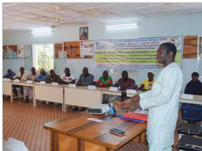
Membres de CVD en formation

Les Conseils Villageois de Développement (CVD) sont mis en place sous la tutelle des Conseils Communaux. Afin que les CVD soient capables d’assurer la planification et la gestion durable du développement local, des formations sont dispensées entre autre sur la maîtrise des rôles, la planification et le suivi des activités communautaires, l’auto-évaluation et la mobilisation des ressources pour le développement local. En 2019, 39 CVD ont été formés grâce à l’appui de CPS.