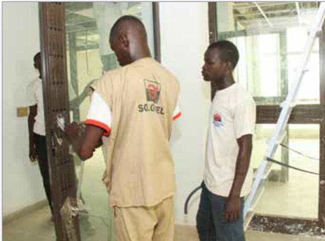
Formation des jeunes électriciens