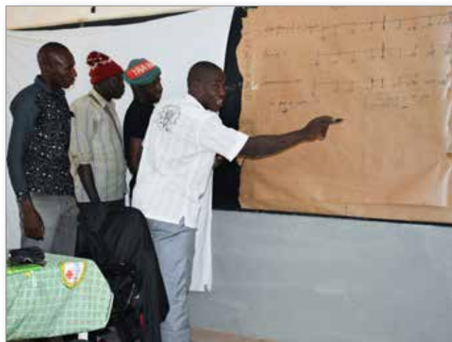
Session de formation d’un comité de gestion

Le renforcement des capacités techniques (agriculture, éducation, maintenance des infrastructures) et fonctionnelles des structures locales de gestion comme l’Association des Usagers de l’Eau (AUE) et les différents Comités de Gestion (COGES) contribuent à assurer une meilleure gestion des projets et aussi leur durabilité. Dans l’accord-cadre 2019-2023, CPS appuie ces structures surtout grâce à des sessions de formation.