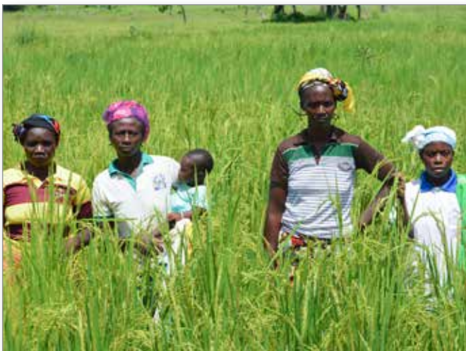
Coopérative de producteurs de riz