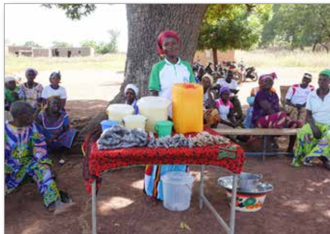
Activité génératrice de revenus

Travailler ensemble, coopérer, se concerter et avoir une activité valorisante et génératrice de revenus renforce aussi la population contre les dérives extrémistes. Cela freine également les migrations vers les grands centres urbains et les domaines agricoles des pays voisins où les conditions de vie sont bien souvent misérables et proche de l’exploitation.