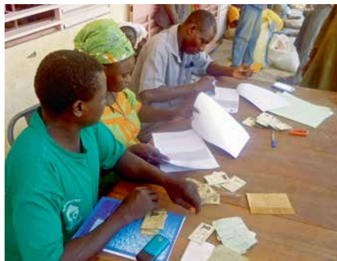
Transparenz wurde groß geschrieben: Nahrungsmittel erhielt nur, wer in der Liste der bedürftigen Haushalte verzeichnet war und einen Personalausweis vorlegen konnte

Die Lebensmittel wurden durch eine öffentliche Ausschreibung erworben und in zwei Etappen an die betroffenen Haushalte verteilt. Hierbei wurde Wert auf Transparenz gelegt, um sicherzustellen, dass die Lebensmittel in die richtigen Hände gelangten.