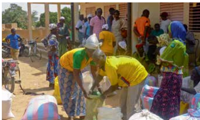
Verteilung der Nahrungsmittel an Hilfsbedürftige in Matiacoali

Nach sorgfältiger Recherche wurden 308 Haushalte als besonders hilfsbedürftig eingestuft und ein Hilfspaket