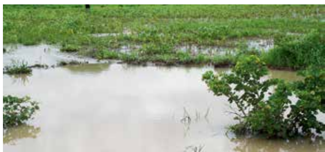
Die Überschwemmungen machten die bevorstehende Ernte zunichte

Schlimmer als die materiellen Schäden wog jedoch der Verlust von Viehbestand und vor allem die Vernichtung mehrerer hundert Hektar Feldfrüchte durch die Wassermassen.