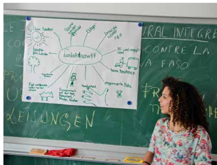
Die Schülerinnen waren mit viel Enthusiasmus bei der Sache