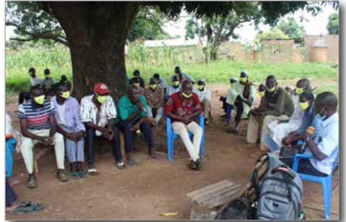
Sensibilisierung in Gouindougouni

Wir unterstützen Kooperativen bei der Anlage von bewässerten Gemüsefeldern von bis zu 2 ha. Die Gemüseproduktion schafft in der Trockenzeit gute Arbeitsmöglichkeiten in ländlichen Gebieten und generiert ein erhebliches Einkommen. Sie profitiert dabei von einem schnell wachsenden Markt.