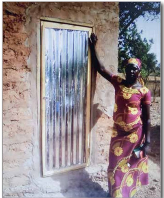
Latrine im Dorf Balla