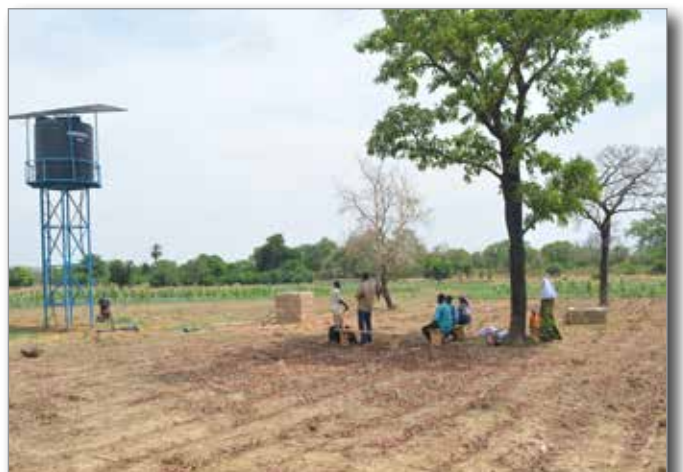
Gemüseanbau in Bakaribougou